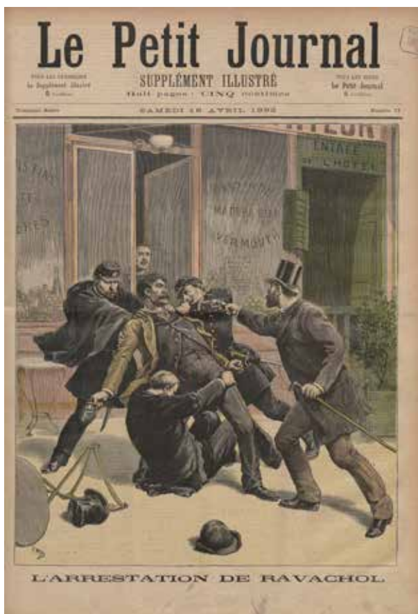
De arrestatie van de anarchist Ravachol in april 1892.

Klems archiefonderzoek bevestigt ook het beeld dat het wel meeviel met de anarchistische dreiging. 'Na de conferentie van Rome zie je dat die beter in kaart wordt gebracht. Maar de meeste van die maandelijkse rapporten zijn keer op keer leeg. Er was simpelweg niets te melden.' 'Nederland deed van meet af aan heel actief mee. 'Voormolen had in Rotterdam een van de meest complete anarchistencollecties in heel Europa - terwijl er