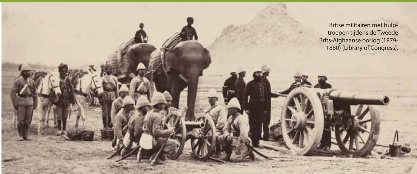
Britse militairen met hulp-troepen tijdens de Tweede Brits-Afghaanse oorlog (1879-1880).

Tadzjikistan, China, Pakistan en Afghanistan precies lopen, bestond na de afspraken tussen Londen en Sint-Petersburg een waar niemandsland. Dit was voor de Britten eind 19de eeuw het enige overgebleven 'veiligheidsgat' tussen Afghanistan en het Himalaya-gebergte. Ze besloten daarom het onherbergzame gebied in kaart brengen om er zeker van te zijn dat het Russische leger niet via de Pamir naar India kon marcheren.