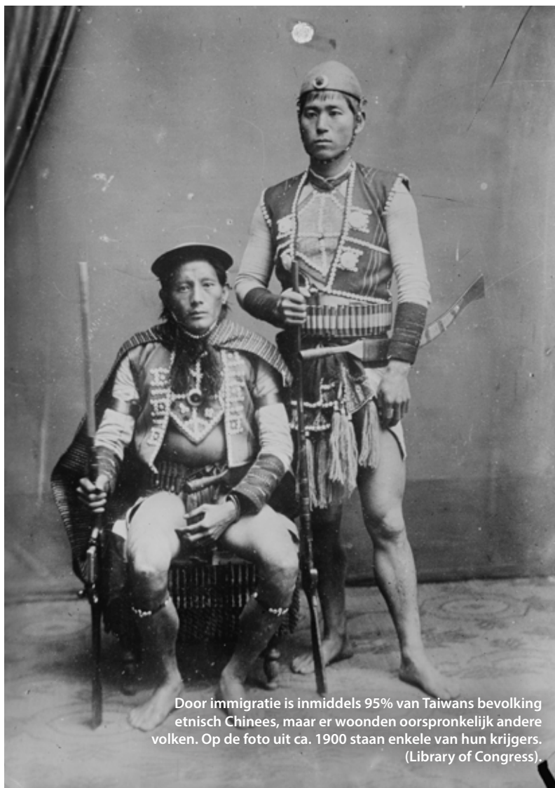
Door immigratie is inmiddels 95% van Taiwans bevolking etnisch Chinees, maar er woonden oorspronkelijk andere volken. Op de foto uit ca. 1900 staan enkele van hun krijgers. (Library of Congress).

De communisten rukten steeds verder op en Chiangs nationalistenvoer zochten een veilig heenkomen op Taiwan. Tussen 1946 en 1949 maakten naar schatting 2 miljoen vastelanders de overstreek, een aanzienlijke bevolkingsgroei: Taiwan had aan het einde van de Tweede Wereldoorlog 7 miljoen inwoners geteld.