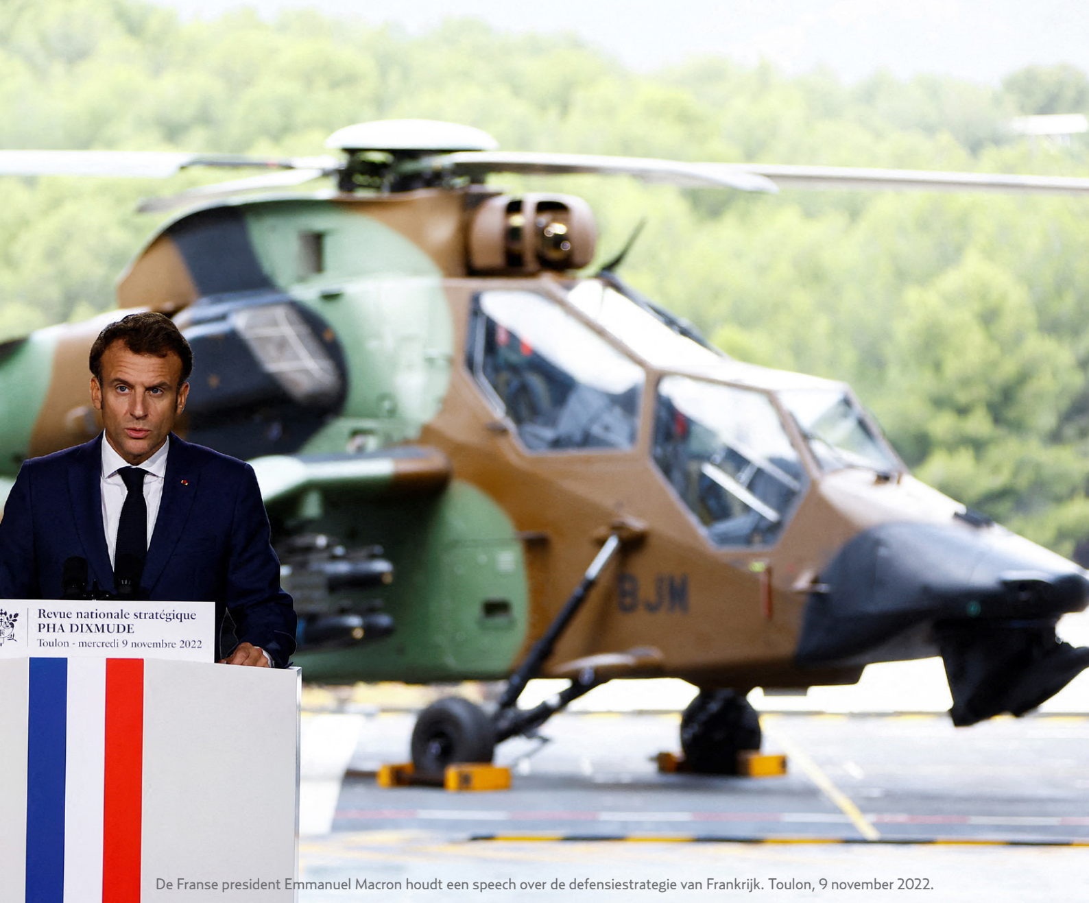
De Franse president Emmanuel Macron houdt een speech over de defensiestrategie van Frankrijk. Toulon, 9 november 2022.

Het lijkt een fundamentele keuze: óf je richt een Europees leger op, óf je blijft braaf lid van de NAVO. Maar in werkelijkheid is die tegenstelling helemaal niet zo duidelijk. Sterker nog: het had niet veel gescheeld of Europa had – mede dankzij de NAVO – allang een eigen leger gehad.