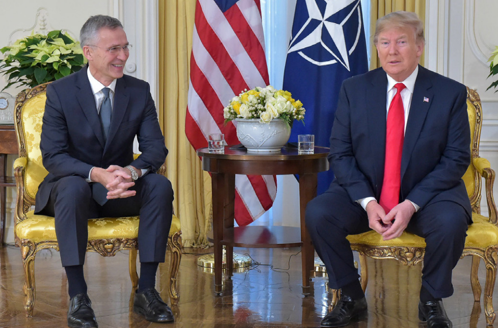
Jens Stoltenberg, secretaris-generaal van de NAVO, ontmoet Donald Trump in 2019.

inzetbaar zijn - en een klein militair hoofdkwartier klaar, maar die zijn nog nooit ingezet in conflictsituaties.