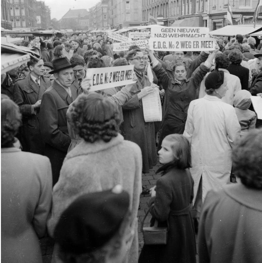
Demonstratie tegen de Europese Defensie Gemeenschap. Amsterdam, 1956.

kreeg ‘van bovenaf’ een communistisch bewind. In 1948 had Stalin geprobeerd om de Amerikanen, Britten en Fransen te verdrijven uit West-Berlijn met een blokkade. Verder weg viel Noord-Korea met steun van de Sovjet-Unie in juni 1950 Zuid-Korea binnen. Het Amerikaanse blok stond onder druk.