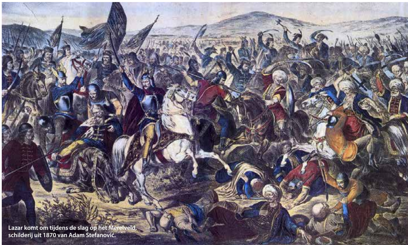
Lazar komt om tijdens de slag op het Merelveld, schilderij uit 1870 van Adam Stefanović.