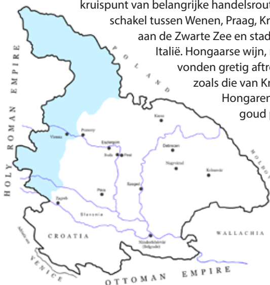
In blauw zijn weergegeven de veroveringen van Matthias Corvinus anno 1490.

het bankwezen in Italiaanse steden als Florence en Venetië zijn weg naar de rest van Europa. Italiaanse architecten en kunstenaars waren graag geziene gasten in de burcht van Boeda. Nu kwam een bediende de aankomst van Leonardo da Vinci melden. De lezende man wilde hem vragen een Madonna te schilderen. Het werk moest een pronkstuk van zijn prestigieuze kunstcollectie worden. Tevreden sloeg hij zijn boek dicht. Er heerste eindelijk rust in zijn grote rijk, dat dankzij zijn oorlogsinspanningen niet alleen Hongarije, maar ook Slowakije, Silezië, Moravië, Kroatië, Transsylvanië, Vojvodina en gebieden rond de Oostenrijkse steden Wenen en Graz omvatte. Buurlanden Moldavië en Wallachije waren trouwe bondgenoten. Zelfs de zuidgrens van zijn rijk was stabiel: dankzij een vredesverdrag was de dreiging vanuit het Ottomaanse Rijk afgewend. Koning Matthias Corvinus was de trotse verdediger van christelijk Europa, wiens daden konden rekenen op instemming van de paus in Rome. Het koninkrijk Hongarije was een Europese supermacht. Dertig jaar later was er van Corvinus' rijk niets meer over. Na een klinkende Ottomaanse overwinning in de Slag bij Mohács resteerde in 1526 slechts een rompstaatje onder Habsburgse heerschappij. De rest was in handen van de sultan in Constantinopel (Istanboel). Dit maakt de periode dat Corvinus de scepter zwaaide over Hongarije des te specialer: 1458-1490 was een gouden tijdperk, maar het is buiten Hongarije zo goed als vergeten.