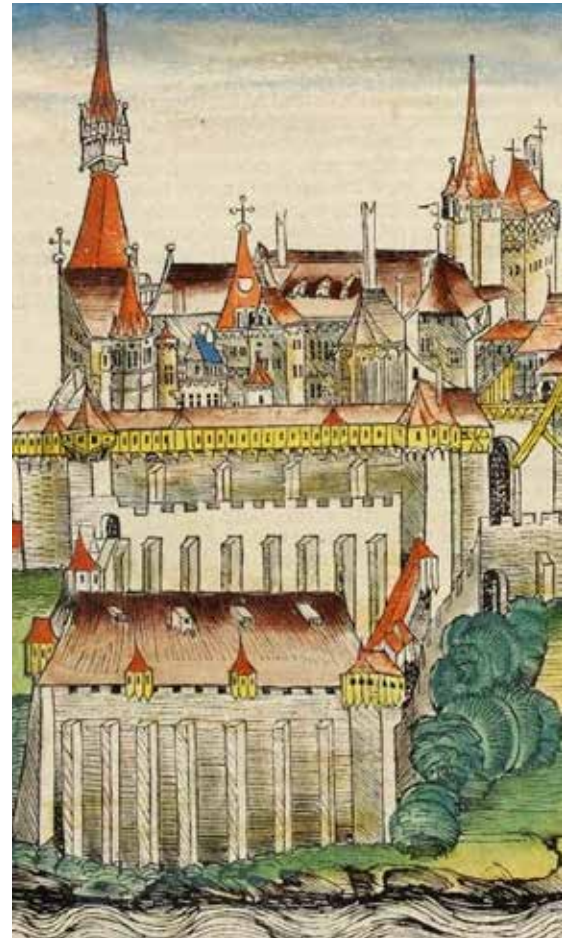
Boeda op een houtsnede uit ca. 1493.