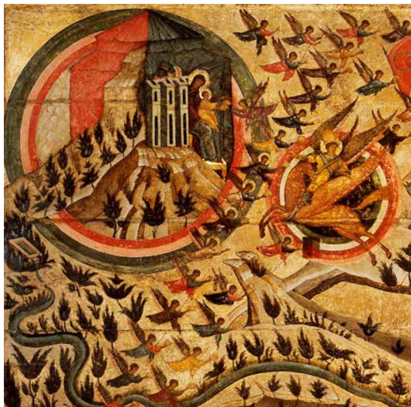
'Gezegend zij het leger van de hemelse tsaar' (na 1562, Tretjakovgalerij, Moskou).

De icoon werd vervaardigd nadat Ivan in 1552 het Tataarse kanaat Kazan had veroverd. De nomadische inwoners van Kazan hadden eeuwenlang aanvallen uitgevoerd op de Russen. Voor tijdgenoten was de symbolische betekenis van het icoon dus direct duidelijk: Sodom