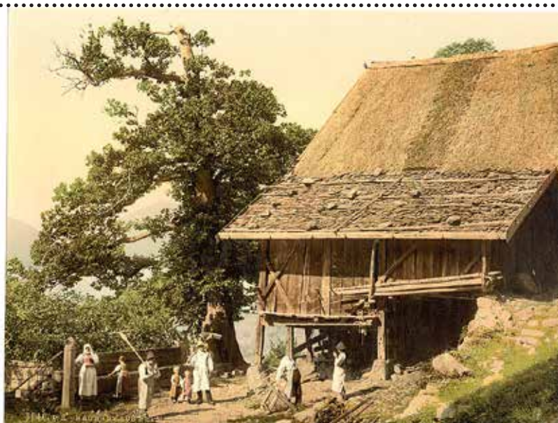
Boerenhuis bij Merano in Zuid-Tirol, ca. 1890-1900.