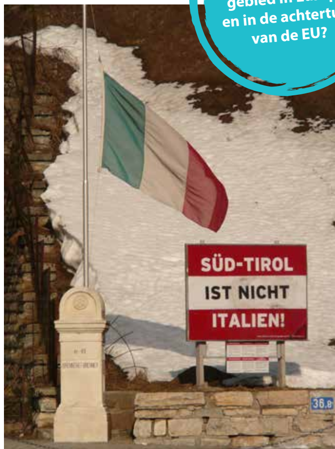
De Italiaans-Oostenrijkse grens bij de Brennerpas. Het bord met de tekst 'Südtirol ist nicht Italien' van de Südtiroler Freiheit-beweging is inmiddels verwijderd.

Probleem was wel dat Italië tot aan de Eerste Wereldoorlog een bondgenootschap vormde met Oostenrijk-Hongarije en Duitsland. Maar toen de geallieerden in het geheime Pact van Londen onder meer de Brennergrens toezegden om de Italianen naar het geallieerde kamp te lokken, wisselde Rome in 1915 van kant. De Italiaanse verrichtingen op het slagveld waren echter niet om over naar huis te schrijven. Het Oostenrijks-Hongaarse leger had