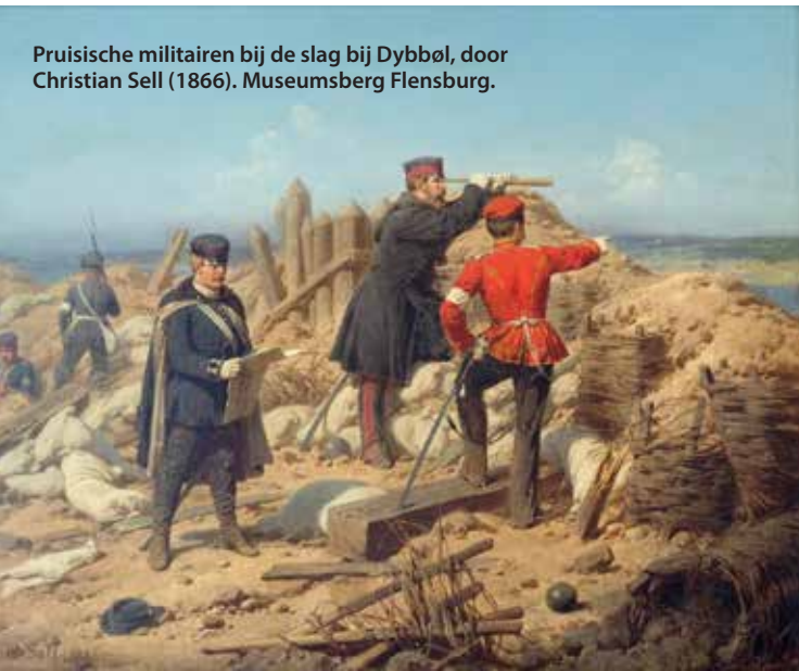
Pruisische militairen bij de slag bij Dybbøl, door Christian Sell (1866). Museumsberg Flensburg.