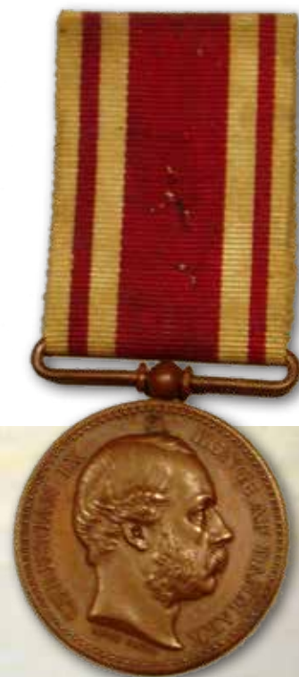
De heldhaftig weergegeven Denen bij de slag bij Dybbøl in 1864, door Vilhelm Rosenstand, Historisch Museum Frederiksborg Slot. Inzet: Veteranenmedaille met beeltenis van de Deense koning Christian IX voor de oorlog van 1864, toen Denemarken Sleeswijk en Holstein definitief verloor.