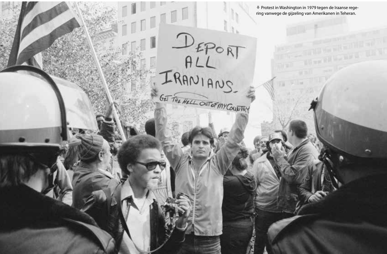
▼ Protest in Washington in 1979 tegen de Iraanse regering vanwege de gijzeling van Amerikanen in Teheran.

buitenlandse mogendheid te raken bleef sterk aanwezig. Ook ayatollah Khomeini, die de in 1989 overleden Khomeini opvolgde als religieus leider, hamerde hier telkenmale op. Het enthousiasme in Iran was daarom ook niet groot toen in 1991 een internationale coalitie aartsvijand Saddam Hoessein versloeg in de Golfoorlog. Hiermee kwam er namelijk een grote westerse troepenmacht in de Iraanse achtertuin te staan. Iran bleef daarom