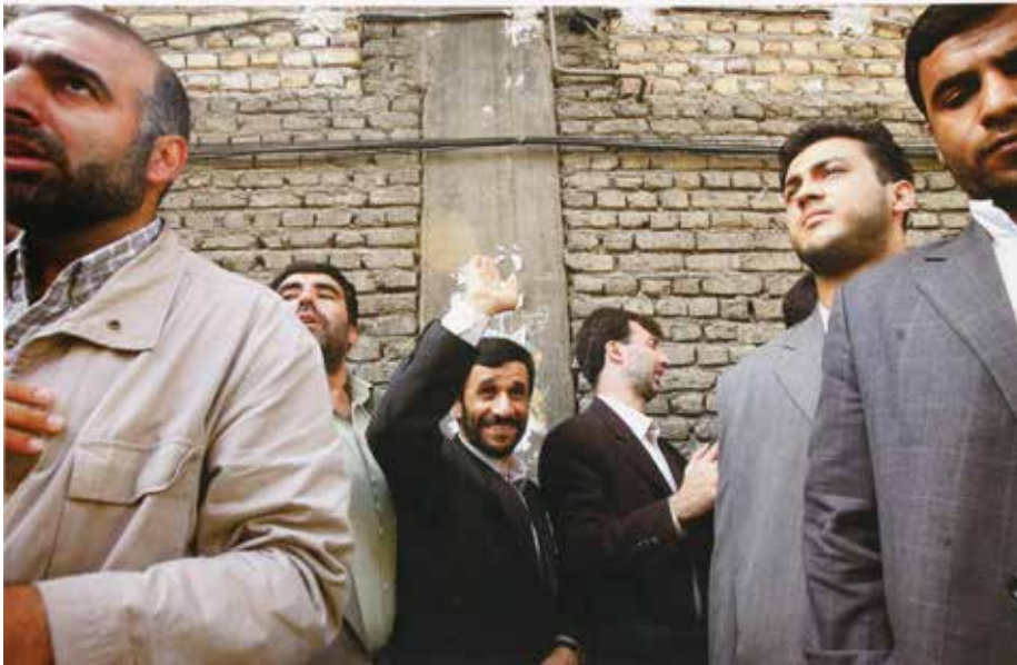
↑ De Iraanse president Mahmoud Ahmadinejad voerde tijdens zijn regeerperiode (2005-2013) een politiek van confrontatie met de Verenigde Staten. Onder: Ahmadinejad omgeven door lijfwachten, juni 2005. Boven: een militaire parade in Teheran in september 2005, waar onder andere deze Shahab 2 raket aan het publiek wordt getoond.

wantrouwend. Door aanhoudende aanslagen van islamitische terreurorganisaties was dat wantrouwen wederzijds. Pas met het aantreden van de gematigde president Mohammad Khatami, die in 1997 opriep tot een Dialoog der Beschavingen, leek er voor het eerst enige dooi op te treden in de Iraans-Amerikaanse relatie. Het waren echter de aanslagen op het World Trade Center in New York en het Pentagon in Washington op 11 september 2001 en de daaropvolgende militaire acties in Afghanistan die tot een doorbraak leidden. Iran maakte zich al langer zorgen om de invloed van de soennitische taliban in Afghanistan en had in 1998 op het punt gestaan het buurland binnen te vallen. Om de taliban te verdrijven maakten de Amerikanen gebruik