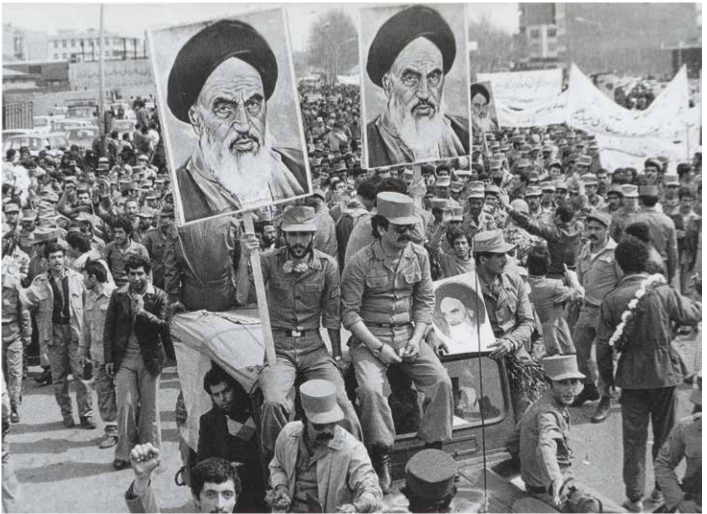
◆ De revolutie van 1979 maakt van Iran een islamitische republiek. Amerika onderhoudt er vanaf het begin zeer moeizame relaties mee, vooral omdat Iran zijn theocratische revolutie naar buurlanden wil exporteren. Op de foto: aanhangers van Khomeini dragen zijn portret door de straten van Teheran.

op onderwijs en cultuur. Hierdoor zou Iran worden tot een willoze westerse pion in het geopolitieke schaakspel. Voor het arme en traditioneel ingestelde deel van de bevolking was dit een aantrekkelijke boodschap; zij viel toch al buiten de economische groei waar vooral een verwesterde kleine elite rond de sjah van profiteerde.