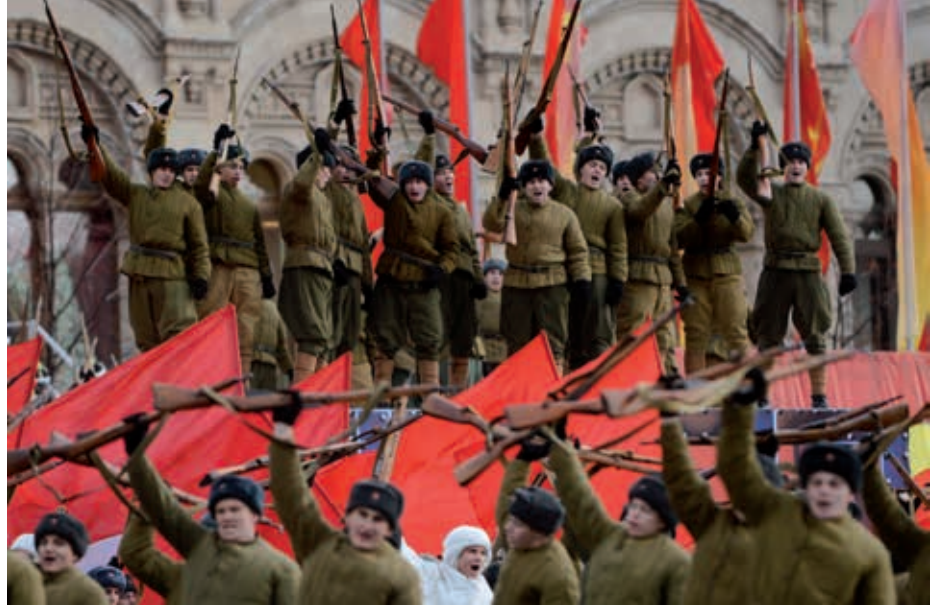
↑ Nostalgie naar de tijd van de machtige Sovjet-Unie? Russische mannen dragen sovjetuniformen uit de Tweede Wereldoorlog en nemen deel aan een paradeoefening op het Rode Plein, 5 november 2012.

Sinds 1991 is de omvang van Rusland voor het eerst kleiner dan tijdens de heerschappij van Catharina de Grote (1648-1727). Gebieden die eeuwenlang onder Russisch bestuur stonden, werden na 1991 onafhankelijk. De politieke elite van Rusland betreurde vooral het verlies van Estland, Letland, Litouwen en in het bijzonder Oekraïne - eens als Kiev-Roes de bakermat van Rusland. Eeuwenlange