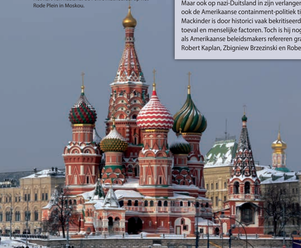
Het hart van Rusland: de Pokrovkathedraal op het Rode Plein in Moskou.

twijfeld als muziek in de oren. Helaas voor hem zijn er nogal wat kanttekeningen te plaatsen bij de 'Hartland'-theorie. Hoewel Rusland een tijdlang de dienst uitmaakte in Oost-Europa, is de Russische poging om de rol van onbetwiste wereldmacht te spelen in de 20ste eeuw gesneefd.