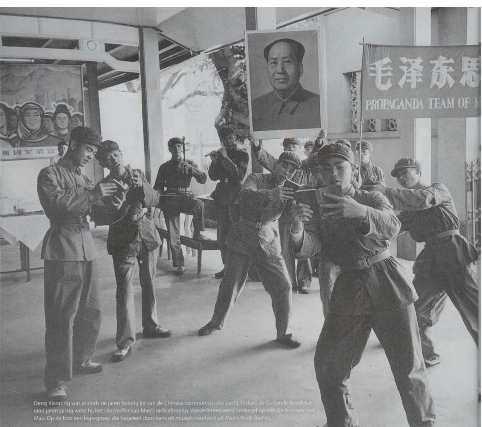
Deng Xiaoping was al sinds de jaren twintig lid van de Chinese communistische partij. Tijdens de Culturele Revolutie eind jaren zestig werd hij het slachtoffer van Mao's radicalisering. Van iedereen werd verlangd op één lijn te staan met Mao. Op de foto een legergroep die begeleid door dans en muziek voorleest uit Mao's Rode Boekje.

E en nieuwe generatie Chinese leiders onder leiding van Xi Jinping heeft eind 2012 vrij geruisloos het roer van de Communistische Partij van China (CCP) overgenomen. Het is de vijfde generatie leiders sinds Mao Zedong. Xi Jinping staat nu aan het hoofd van de economische en diplomatieke grootmacht die China vandaag de dag is. Het land weet nog steeds groeicijfers te realiseren waar menig westers land jaloers op is. De eerste reis die Xi maakte na zijn aantreden, was een 'Zuidelijke Toer' door de provincie Guangdong. Volgens veel commentatoren refereerde Xi hiermee aan de Zuidelijke Toer van Deng Xiaoping, die in China wordt geroemd als de architect van de economische